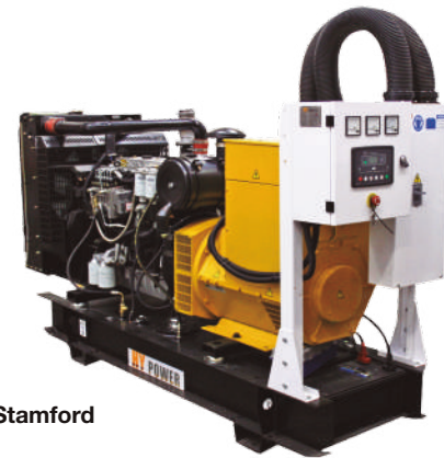
*Motor Lovol *Alternador Stamford

Derateo por altitud : 2% por cada 300m para alturas mayores a 1000 msnm. Para altitudes mayores a 2450 msnm contacte un asesor de Ignacio Gómez IHM SAS. Derateo por Temperatura: 6% por cada 11 grados centígrados para temperaturas superiores a 35%.