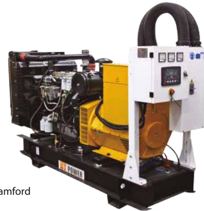
*Motor Lovol *Alternador Stamford

Derateo por altitud : 2% por cada 300m para alturas mayores a 1000 msnm. Para altitudes mayores a 2450 msnm contacte un asesor de Ignacio Gómez IHM SAS. Derateo por Temperatura: 6% por cada 11 grados centígrados para temperaturas superiores a 35%.