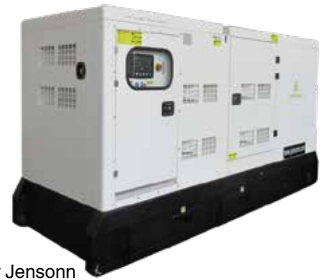
*Motor Jensonn *Generador Jensonn

DSD: Debe ser determinada N/D: No disponible CP: Continuois Power FSP: Fuel Stop Power Altitud